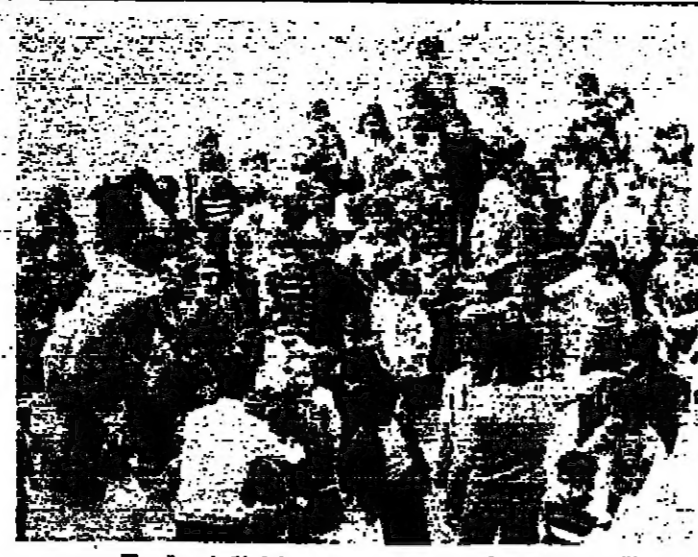
مدرسة في اهد اهية بيروت تديرها لجنة شيعية

١ - تبدأ الدراسة صباح يوم السبت في ٢٦ ذي القعدة ١٣٦٥ هـ الموافق ١١/٢٩/١٩٧٥ م في المدارس التالية : ثانوية المقاصد الاسلامية بيت الاطفال - الفرع الفرنسي ثانوية خالد بن الوليد بيت الاطفال - الفرع الانكليزي ثانوية الامام الحسين بن علي ثانوية المقاصد الاسلامية للبنات ثانوية خديجة الكبرى ثانوية عمر بن الخطاب ابتدائية عمر بن الخطاب ابتدائية خديجة الكبرى ابتدائية عائشة أم المؤمنين ابتدائية فاطمة الزهراء ابتدائية خليل شهاب ابتدائية راس بيروت العلوي مركز اعداد المعلمين ٢ - يكون الدوام من الساعة الثامنة صباحا حتى الساعة الواحدة بعد الظهر . ٣ - يتحمل اولياء التلامذة مسؤولية انتقال اولادهم من والى المدرسة . ٤ - اما فيما يخص ثانوية علي بن ابي طالب ، وابتدائية علي بن ابي طالب ( عثمان ذي النورين ) ، وابتدائية ابي بكر الصديق وابتدائية الخضر ، فالجمعية حرصت على بدء الدراسة فيها في اشرف فرصة ممكنة . ٥ - يجتمع افراد الهيئة التعليمية في المدارس الثانوية الثانوية للجمعية يوم الثلاثاء في ٢٣ ذي القعدة ١٣٦٥ هـ الموافق ١١/٢٥/١٩٧٥ م في ثانوية عمر بن الخطاب الساعة العاشرة صباحا ، كما اعلن سابقا . ٦ - يجتمع افراد الهيئة التعليمية في المدارس الابتدائية الثانوية للجمعية يوم الاربعاء في ٢٣ ذي القعدة ١٣٦٥ هـ الموافق ١١/٢٦/١٩٧٥ م في ثانوية المقاصد الاسلامية - الحرج الساعة العاشرة صباحا . ٧ - يعين هذا البيان دعوة شخصية لكل من المعلمين المؤمنين .